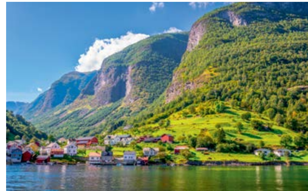
IDYLLE AM FJORD