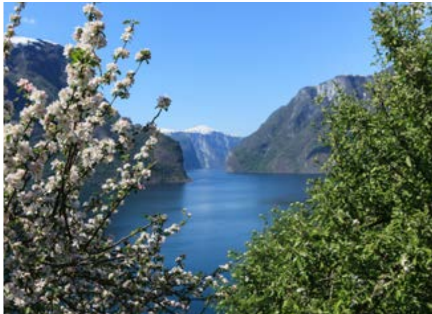
FRÜHLING AM AURLANDSFJORD