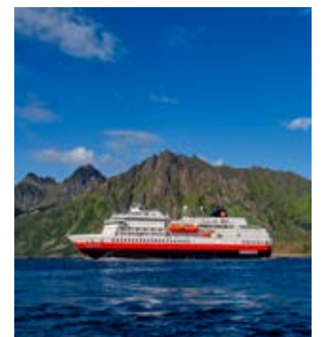
MS FINNMARKEN