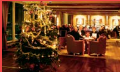
WEIHNACHTEN AN BORD